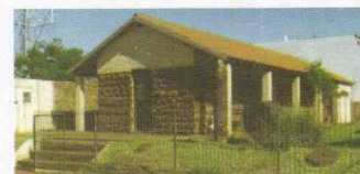
MUSEU MONSENHOR ESTANISLAU WOLSKI